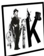
Kéményseprő-ipari tevékenységet ellátók térképe (2016.08.17-i állapot szerint)